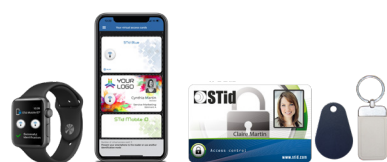
Smartphones / Montres connectées Bluetooth® & NFC avec application STid Mobile ID® Badges ISO & porte-clés 13,56 MHz ou bi-fréquences