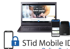
Plateforme Web pour une gestion à distance de vos badges virtuels

*Nos lecteurs lisent uniquement le numéro de série / UID PICO1444-3B de la puce iCLASS™. Ils ne lisent ni les protections cryptographiques iCLASS™ ni le numéro de série / UID PICO 15693 de HID Global.