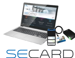
Kit de programmation SECARD et les protocoles SSCP® v1 & v2® et OSDP™