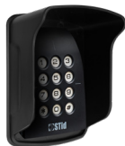
Casquette de protection