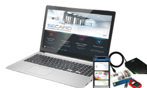
SECARD Kit de programmation SECard et les protocoles SSCP® v1 & v2 et OSDP™

**Attention : informations sur les distances de communication : mesurées au centre de l'antenne, dépendant de la configuration de l'antenne, de l'environnement d'installation du lecteur, de la température, de la tension d'alimentation et du mode de lecture (sécurisé ou non). Des perturbations externes peuvent provoquer la diminution des distances de lecture. Mentions légales : STid, Architect® et SSCP® sont des marques déposées de STid SAS. Toutes les marques citées dans le présent document appartiennent à leurs propriétaires respectifs. Tous droits réservés – Ce document est l'entière propriété de STid. STid se réserve le droit, à tout moment et ce sans préavis, d'apporter des modifications sur le présent document et/ou d'arrêter la commercialisation de ses produits et services. Photographies non contractuelles