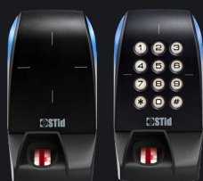
Disponible en version standard ou clavier