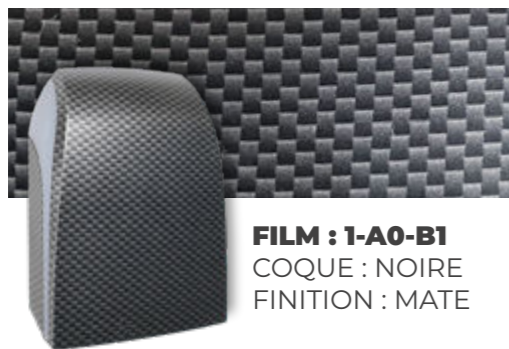
FILM : 1-A0-B1 COQUE : NOIRE FINITION : MATE