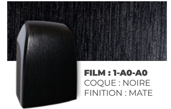
FILM : 1-A0-A0 COQUE : NOIRE FINITION : MATE