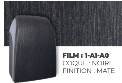
FILM : 1-A1-A0 COQUE : NOIRE FINITION : MATE