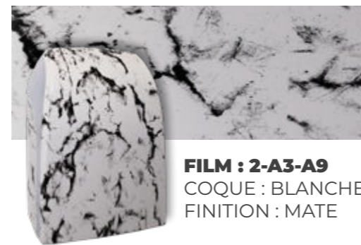
FILM : 2-A3-A9 COQUE : BLANCHE FINITION : MATE