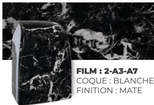
FILM : 2-A3-A7 COQUE : BLANCHE FINITION : MATE