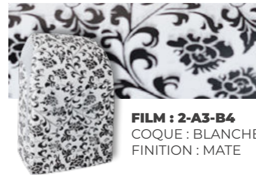
FILM : 2-A3-B4 COQUE : BLANCHE FINITION : MATE