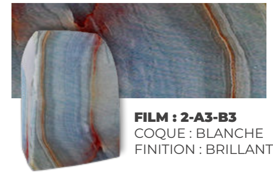
FILM : 2-A3-B3 COQUE : BLANCHE FINITION : BRILLANTE