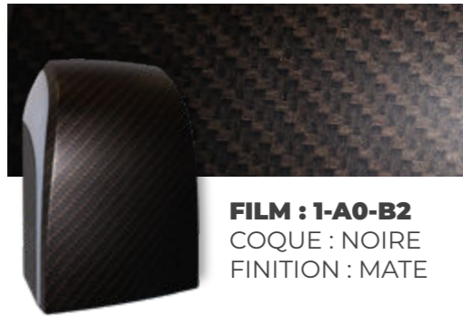
FILM : 1-A0-B2 COQUE : NOIRE FINITION : MATE