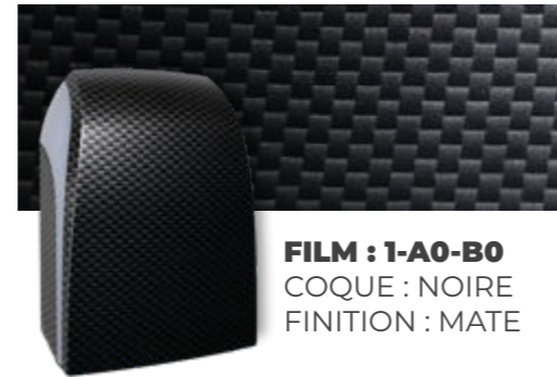
FILM : 1-A0-B0 COQUE : NOIRE FINITION : MATE