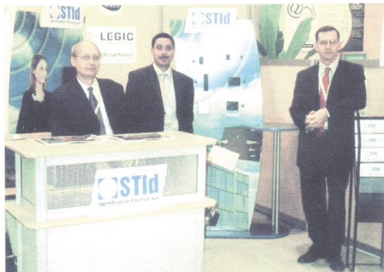
Le stand STID

The next edition will be held from 2nd to 4th November 2005. It will also be the occasion to celebrate the 20th anniversary of CARDS, and to launch their new identification dedicated space. The CREMSI team will be there to welcome you in 2005. ■