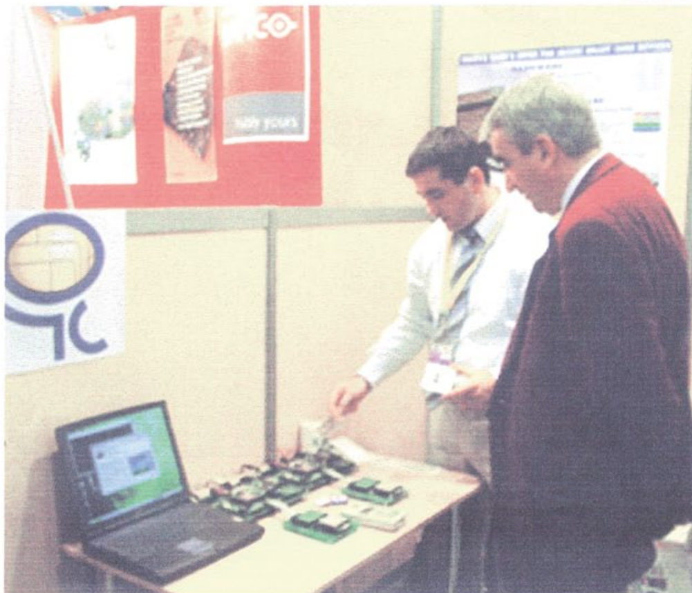
Essai de cartes

La prochaine session se tiendra du 02 au 04 novembre 2005, au cours de laquelle sera célébré le 20ème anniversaire de CARTES et le lancement de leur nouvel espace dédié Identification. L'équipe du CREMSI vous donne rendez-vous en 2005.