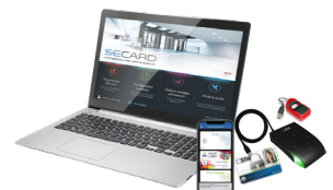
SECARD Kit de programmation SECARD et les protocoles SSCP® v1 & v2 et OSDP™ v1 & v2

**Attention : informations sur les distances de communication : mesurées au centre de l'antenne, dépendant de la configuration de l'antenne, de l'environnement d'installation du lecteur, de la température, de la tension d'alimentation et du mode de lecture (sécurisé ou non). Des perturbations externes peuvent provoquer la diminution des distances de lecture. Mentions légales : STid, Architect® et SSCP® sont des marques déposées de STid SAS. Toutes les marques citées dans le présent document appartiennent à leurs propriétaires respectifs. Tous droits réservés - Ce document est l'entière propriété de STid. STid se réserve le droit, à tout moment et ce sans préavis, d'apporter des modifications sur le présent document et/ou d'arrêter la commercialisation de ses produits et services. Photographies non contractuelles