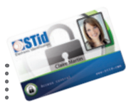
Badges ISO standards Badges ISO hybrides MIFARE®