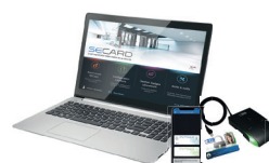
Kit de programmation SECARD et les protocoles SSCP® v1 & v2® et OSDP™