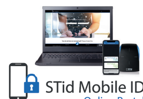
Plateforme Web pour une gestion à distance de vos badges virtuels