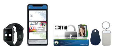
Smartphones / Montres connectées Bluetooth® & NFC avec application STid Mobile ID® Badges ISO & porte-clés 13,56 MHz ou bi-fréquences