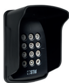
Casquette de protection