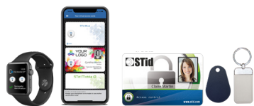
Badges ISO & porte-clés 13,56 MHz ou bi-fréquences Smartphones / Montres connectées Bluetooth® & NFC avec application STid Mobile ID®