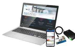
SECARD Kit de programmation SECard et les protocoles SSCP® v1 & v2 et OSDP™ v1 & v2