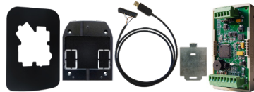
Plaque d'embellissement / Spacer / Câbles convertisseurs / Plaque de renfort...