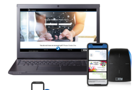
STid Mobile ID Online Portal Plateforme Web pour une gestion à distance de vos badges virtuels

**Attention : informations sur les distances de communication : mesurées au centre de l'antenne, dépendant de la configuration de l'antenne, de l'environnement d'installation du lecteur, de la température, de la tension d'alimentation et du mode de lecture (sécurisé ou non). Des perturbations externes peuvent provoquer la diminution des distances de lecture. Mentions légales : STid, STid Mobile ID®, Architect® et SSCP® sont des marques déposées de STid SAS. Toutes les marques citées dans le présent document appartiennent à leurs propriétaires respectifs. Tous droits réservés - Ce document est l'entière propriété de STid. STid se réserve le droit, à tout moment et ce sans préavis, d'apporter des modifications sur le présent document et/ou d'arrêter la commercialisation de ses produits et services. Photographies non contractuelles